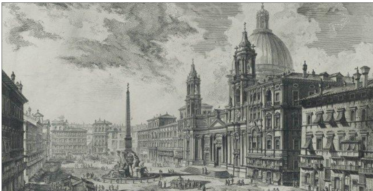
Roma: Piranesi, 1751 (Estado, 1778?) Estampa: aguafuerte; huella de la plancha 410 x 553 mm en h. de 545 x 766 mm Invent/19084

En la muestra se pueden ver las series que reflejan las pesadillas y el mundo onírico del grabador: Carceri , Opere Varie , Il Campo Marzio dell'Antica Roma y Raccolta di disegni del Guercino . A estas obras les acompañan también grabados de otros autores que ejercieron una decisiva influencia en el trabajo de Piranesi.