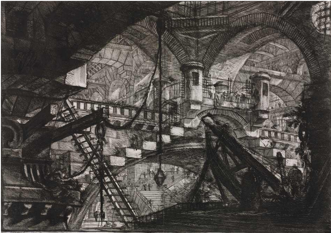
Giovanni Battista Piranesi. Interior de prisión con las dos garitas

Uno de los objetos más atrayentes de la muestra son las series dedicadas a los sueños y pesadillas representados en Carceri (1745-1750 y 1761), las Opere Varie (1750), Il Campo Marzio dell'Antica Roma (1762) o la Raccolta di disegni del Guercino (1764).